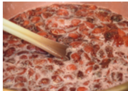
↑ Ambachtelijke aardbeienoefnituur op het vuur

Ben jij ook zo nieuwsgierig naar hoe onze grootouders hun eten en drinken bewaarden zonder koelkast of diepvries? Of zelfs zonder electriciteit in huis? Experts tonen je enkele lekkere bewaarmethodes uit grootmoeders tijd, die je ter plekke kan proeven en thuis zelf kan toepassen. Of het nu gaat om roken, pekelen, drogen of fermenteren ... met deze technieken heb je geen bewaarmiddelen meer nodig!