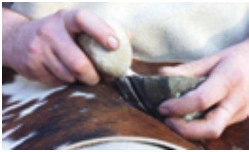
↑ Préhistosite de Ramouil 2004