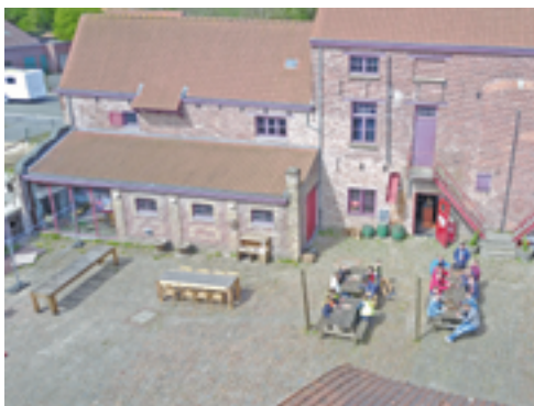
↑ © De Kinderbrouwerij

Op de site van de oude brouwerij Sint-Joris in Reningelst organiseert De Kinderbrouwerij een brouwersworkshop. Uiteraard krijgen we als eindresultaat geen alcoholisch schuimend gerstenat, maar een drankje op maat van de kinderen. Tijdens de workshop kunnen ouders en andere geïnteresseerden van een rondleiding genieten op de oude brouwerssite.