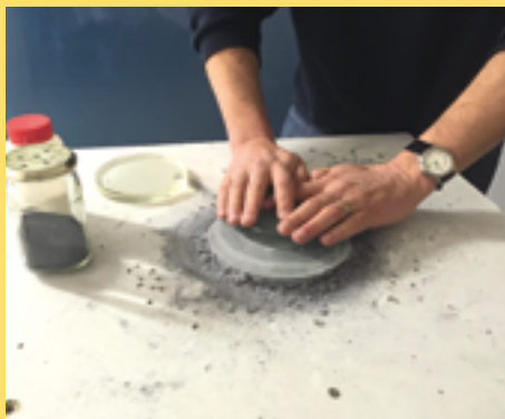
↑ Spiegel slijpen in AstroLAB • © AstroLAB IRIS

De beste en grootste sterrenkijkers werden vroeger gebouwd door liefhebbers. Ook nu zijn er nog amateurs aan de slag die zelf hun sterrenkijker bouwen en hun kennis doorgeven aan anderen. Deze zelfbouwsterrenkijkers zijn meestal van betere kwaliteit en maken, wat de optiek betreft, gebruik van eeuwenoude inventieve methodes. Ook jij kan meehelpen testen en slijpen aan een spiegel!