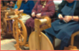
↑ Spinnewielen in volle actie

Hoe maak je van een ruwe schapenvacht een zalig warme trui? Wulle Kobbe neemt je mee op pad doorheen het proces van