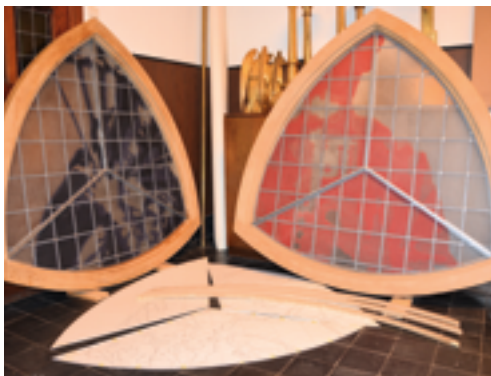
↑ Nieuwe glas-in-loodramen

Mogen we je voorstellen aan de twee gloednieuwe glas-in-loodramen van de Sint-Pieterskerk? Kom ze bewonderen in hun volle glorie. Breng zeker ook je kinderen of kleinkinderen mee, want zij kunnen op zoek naar de plaats waar de afbeeldingen van de twee glasramen in de kerk terug te vinden zijn.