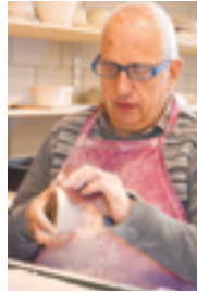
↑ Afwerken van keramiek in het atelier

Allerhande oude ambachten en technieken worden door de mensen op De Lovie nog elke dag gebruikt om tot prachtige eindproducten te komen. Op een interactieve manier maak je kennis met authentieke manieren van kaarsen maken, stoelen vlechten, klei verwerken tot keramiek,