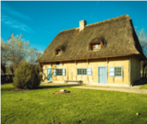
↑ Landarbeiderswoning uit Oostvleteren

In 1958 werd een vakwerkwoning uit Oostvleteren heropgebouwd in het Openluchtmuseum Bokrijk. Op zaterdag 27 april reizen we er met de bus naartoe om er de woning te bezichtigen onder leiding van een gids. Tijdens Erfgoeddag zelf kan je in het dorpshuis van Westvleteren kennismaken met vakwerkbouw in de regio Vleteren / Poperinge / Alveringem.