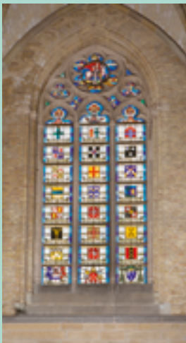
↑ Glasraam van atelier Colpaert uit 1965 met de wapenschilden en -spreuken van de bisschoppen van Ieper

INSCHRIJVEN • verplicht (t.e.m. 25 april) | W www.co7.be