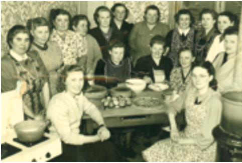
↑ KAV Westouter leert taarten bakken in café Sint-Hubert (ca. 1950) • © 'Westhoek verbeeldt', privécollectie

De Zoetemarkt in Kemmel vindt plaats op Pinkstermaandag en is een begrip in de regio. Ter gelegenheid van de 40 ste editie is er een tentoonstelling over de Zoetemarkt én over de historiek van gebak en snoepgoed. Bezoek de tentoonstelling onder ludieke maar kundige begeleiding van onze huisbakker!