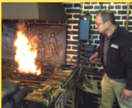
↑ © Serge Braem

De smid van 't Rattekot toont je hoe hij vroeger met hamer en aambeeld gereedschap maakte. De vierdejaars van het VTI leper ontwierpen miniatuur metaalbewerkingsmachines en visualiseerden hiervan het vervaardigingsproces. De 5 de klas van De Torteltuyn vertelt je over het maakproces in Made in Inox. Speurneuzen kunnen een boeiende bedrijfszoektocht spelen, gemaakt door basisschool De Waaier uit Watou. Ook de creaties van de kunstenroute van basisschool Klavertje 3 uit Oostvleteren kan je bewonderen. Kortom, voor klein en groot zijn er doe-activiteiten.