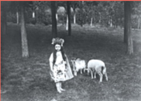
↑ De vier jaar oude Marguerite in de boomgaard

Marguerite Yourcenar bracht haar kindertijd door op de Zwarteberg en verwees hiernaar in haar werk. Keer terug in de tijd en leer de jonge Marguerite kennen, rennend door de boomgaard en bossen aan de schreve. Ontdek vandaag heel wat extraatjes: de hyacinten, een ontmoeting met de Bergdichter en zoveel meer. Er is onthaal bij de start, maar je wandelt op eigen houtje.