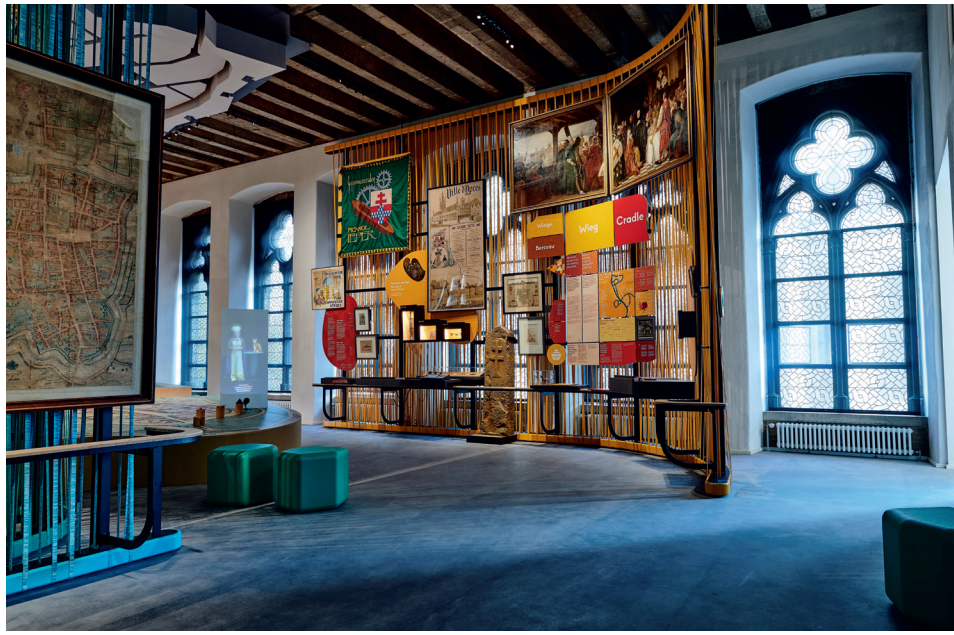
Met kleurrijk geweven linten, een verwijzing naar het textielverleden, zijn halfdoorzichtige hoekjes gecreëerd waarop de gepresenteerde werken lijken te zweven

GEEN DOEKJES Het vernieuwde stadsmuseum is alvast 'Ieperser' geworden. Eerst is er de verhuis – of eigenlijk de terugkeer van de negentiende-eeuwse voorloper – naar de Lakenhallen. Wat is er typischer voor Ieper dan dit UNESCO-werelderfgoed en Europa's grootste burgerlijke gebouw in neogotische stijl? Net als het stedelijke In Flanders Fields Museum (IFFM) neemt het Yper Museum er nu ook een vleugel in. Architectenbureau FVWW (Frederic Vandoninck en Wouter Willems) ging aan de slag met de voormalige loketenzaal van het stadhuis en de kattenzolder. Een stuk vloer werd weggenomen zodat je nu al van een verdieping lager het betonnen cassettegewelf kan bewonderen. Logisch om hier het verhaal van de lakenhandel te brengen die van Ieper – na Gent en Brugge – de derde middeleeuwse grootstad van de Lage Landen maakte. Amsterdam en Antwerpen moesten nog de eerste heipaal in de grond slaan.