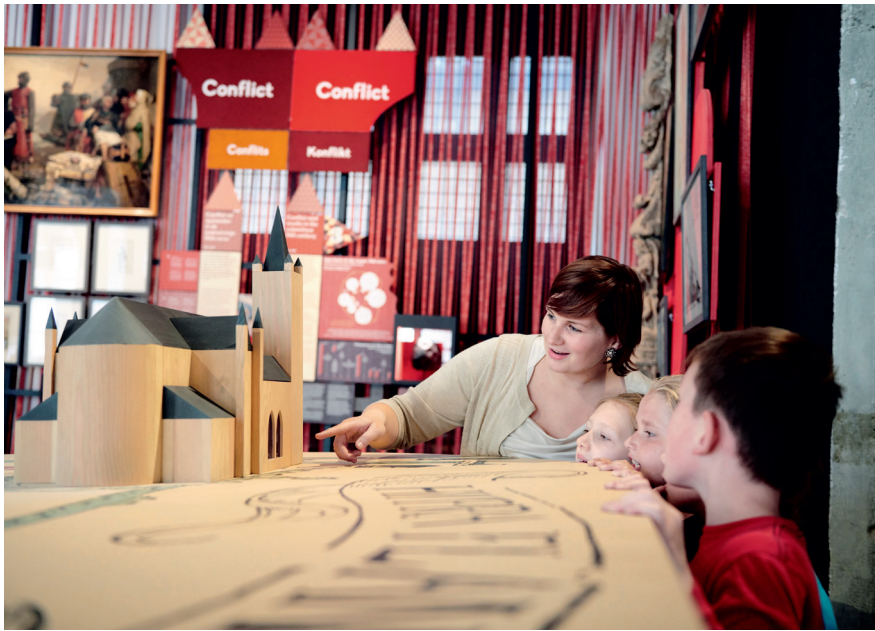
Een reuzenmaquette van het middeleeuwse Ieper