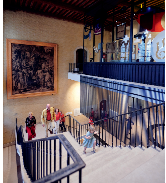
De Lakenhallen: de logische plek voor het Yper Museum

De grootste prestatie was nog om jongeren voor het museum te interesseren. Op vrijwillige basis lieten zestien- tot achttienjarigen uit alle middelbare scholen zich onderdompelen in de collectie – soms letterlijk tijdens A Night at the Museum – om dan te brainstormen over de jongerenwerking. Wegens succes wordt dit ‘Voorlopig Bewind’ nu permanent.