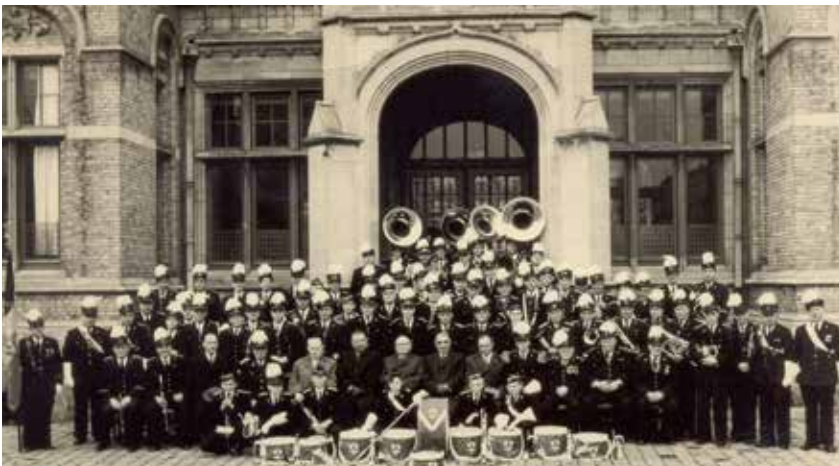
||: Voorstelling van de nieuwe gala-uniformen op 15 november 1959