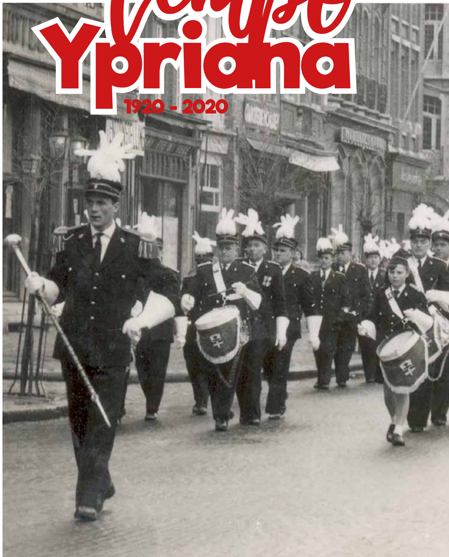
1960 :||: Harmonie Ypriana op uitstap naar aanleiding van haar 40-jarig bestaan.