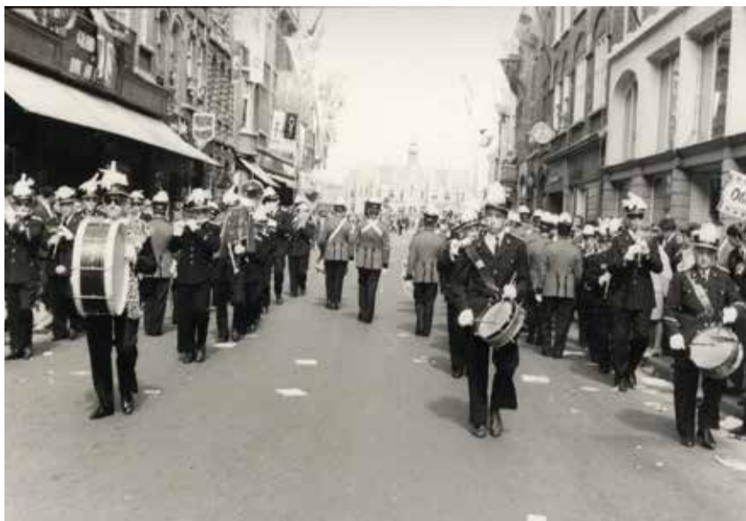
||: De Koninklijke Harmonie Ypriana in de Boterstraat, met zicht op het Gerechtshof.

In de eerste editie van 'Tempo Ypriana' kon u al lezen over het rijke verleden van Ypriana vanaf de oprichting tot aan de Tweede Wereldoorlog. Dit tweede nummer belicht de geschiedenis van na de Tweede Wereldoorlog tot het jaar 1970. Deze florissante periode omvat een boeiende historie die dankzij de archivarissen nauwkeurig werd bijgehouden voor de komende generaties. Wie een bezoek brengt aan het leperse stadsarchief kan met eigen ogen zien hoe rijk gevuld en goed bewaard de collectie van Ypriana is. Uiteraard kan niet alles vermeld worden in deze editie en zijn we genooddaakt ons te beperken tot enkele hoogtepunten.